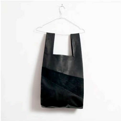
0012. shoppingbag leather colors black